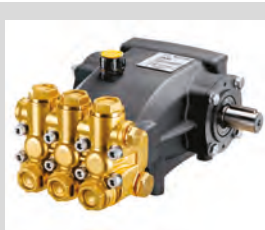
Pompa a pistoni in ceramica Ceramic plunger pumps TNM