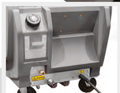
Dettaglio ingresso/uscita Inlet and Outlet