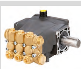
Pompa a pistoni in ceramica Ceramic plunger pumps TCR